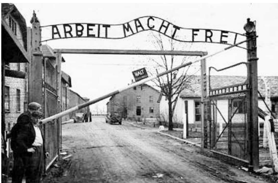
Entrada do Campo de Concentração de Auschwitz.

O Holocausto , também conhecido como Shoá (catástrofe, destruição), foi o genocídio ou assassinato em massa de cerca de seis milhões de judeus durante a Segunda Guerra Mundial, através de um programa sistemático de extermínio étnico patrocinado pelo Estado nazi, liderado por Adolf Hitler, e que ocorreu em todo o Terceiro Reich e nos territórios ocupados pelos alemães durante o período de guerra. Apesar do maior número de vítimas terem sido Judeus, houve muitas outras minorias perseguidas e exterminadas: ciganos, polacos, comunistas, homossexuais, prisioneiros de guerra soviéticos, deficientes físicos e mentais, entre outros.