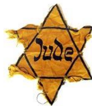
Estrela que identificava os Judeus.

Em 1941, iniciaram-se as preparações necessárias para a designada “solução final para a questão judaica”. Os Judeus foram enviados em massa para campos de trabalho forçado – campos de concentração. Nestes, milhões de judeus foram assassinados através de mecanismos de asfixia por gás venenoso ou por fuzilamento, e muitos outros morreram devido às atrocidades cometidas contra eles pelos alemães e seus colaboradores, por fome, maus-tratos, espancamento, frio, doenças, experiências “médicas”, e outras formas de crueldade inimagináveis. No total, seis milhões de judeus-homens, mulheres e crianças- foram mortos pelos nazis durante o Holocausto, aproximadamente 2/3 dos judeus que viviam na Europa antes da Segunda Guerra Mundial.