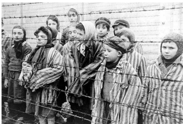
Crianças no campo de concentração de Auschwitz.

Em 1941, iniciaram-se as preparações necessárias para a designada “solução final para a questão judaica”. Os Judeus foram enviados em massa para campos de trabalho forçado – campos de concentração. Nestes, milhões de judeus foram assassinados através de mecanismos de asfixia por gás venenoso ou por fuzilamento, e muitos outros morreram devido às atrocidades cometidas contra eles pelos alemães e seus colaboradores, por fome, maus-tratos, espancamento, frio, doenças, experiências “médicas”, e outras formas de crueldade inimagináveis. No total, seis milhões de judeus-homens, mulheres e crianças- foram mortos pelos nazis durante o Holocausto, aproximadamente 2/3 dos judeus que viviam na Europa antes da Segunda Guerra Mundial.