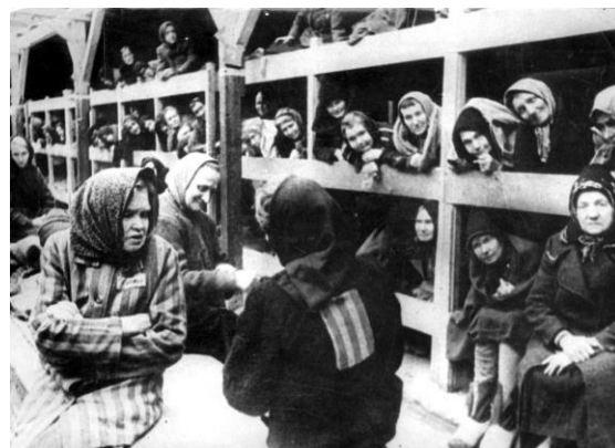
Prisioneiras de um campo de concentração.