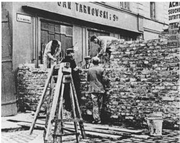
Construção do gueto de Varsóvia.