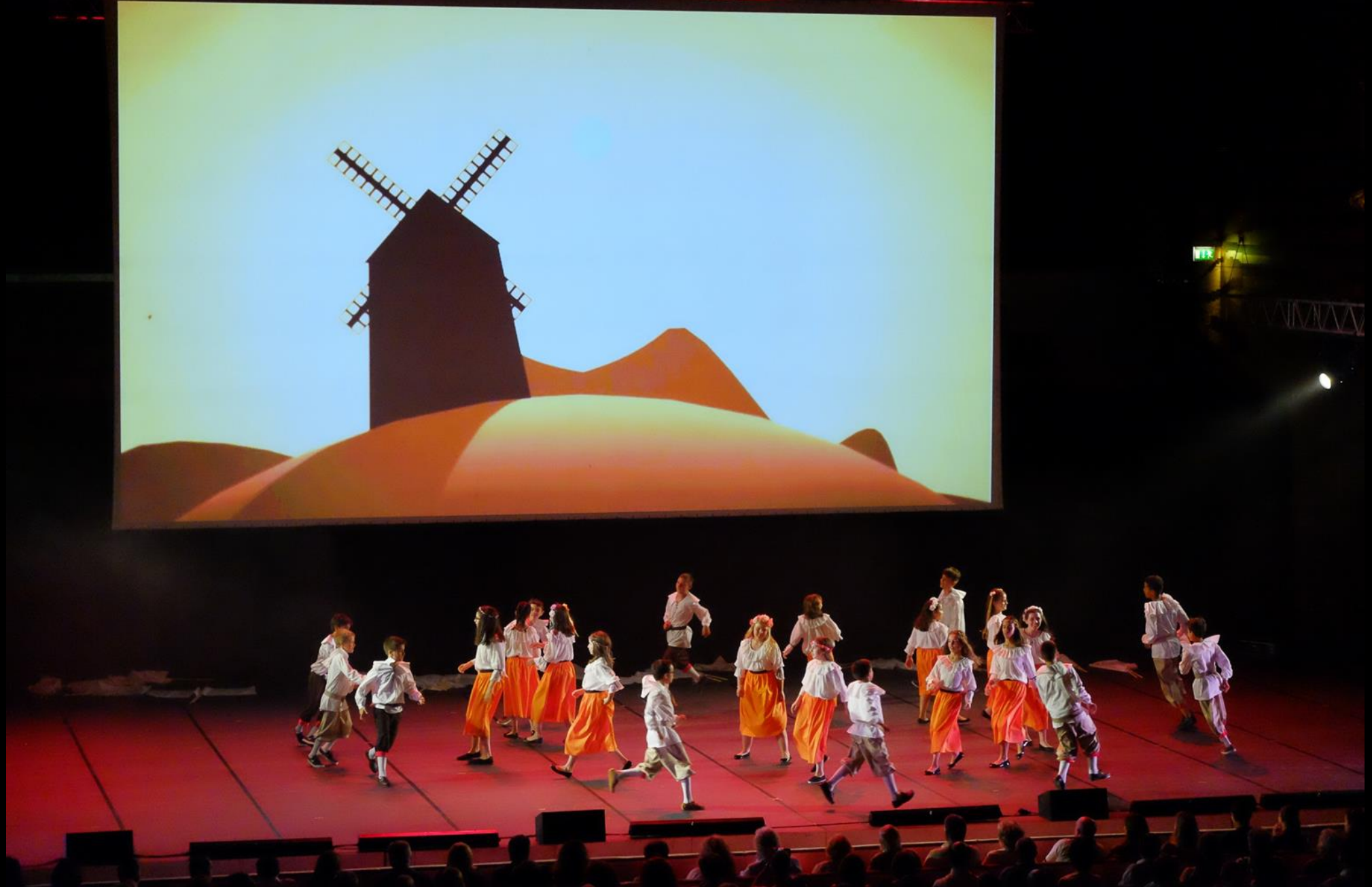
5º ano – D. Quixote De La Mancha – Miguel Cervantes