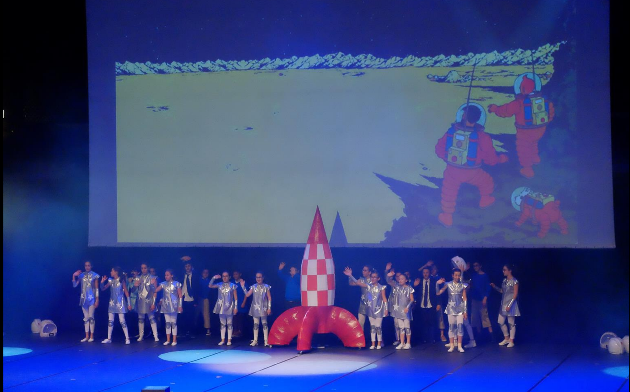
6º ano – Tintim e a viagem à Lua – Hergé