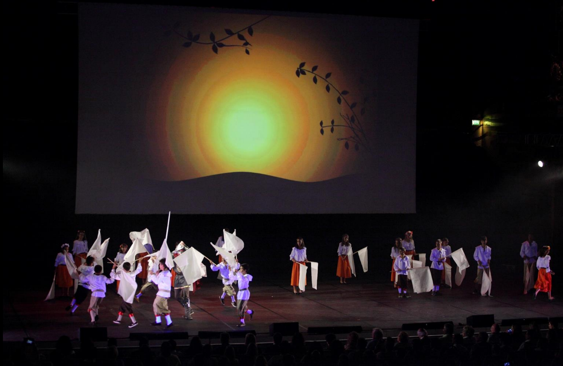
5º Ano – D. Quixote De La Mancha – Miguel Cervantes